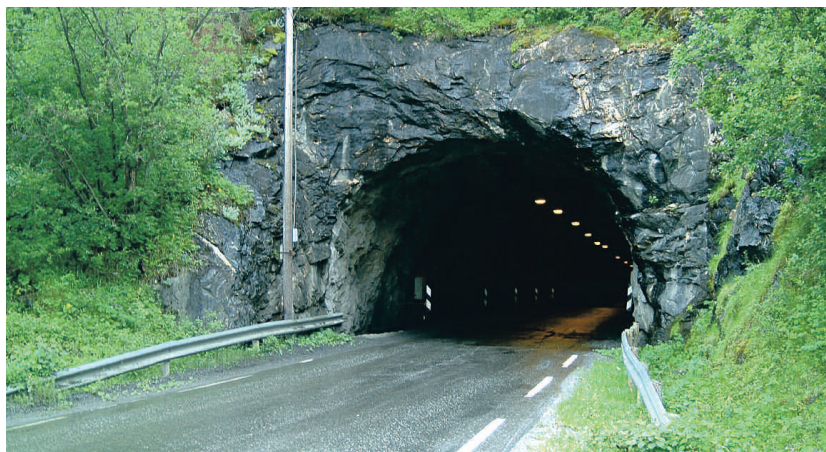
PENGER KOMMER. Nå skal både drenering og asfalt utbedres i tunnelene mellom Fauske og Sulis.