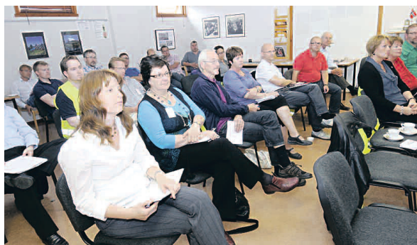
TILHØRERNE. Det var en samling av fylkes- og lokalpolitikere som møtte opp på det første møtet NHO sto bak mellom næringsliv og politikere.